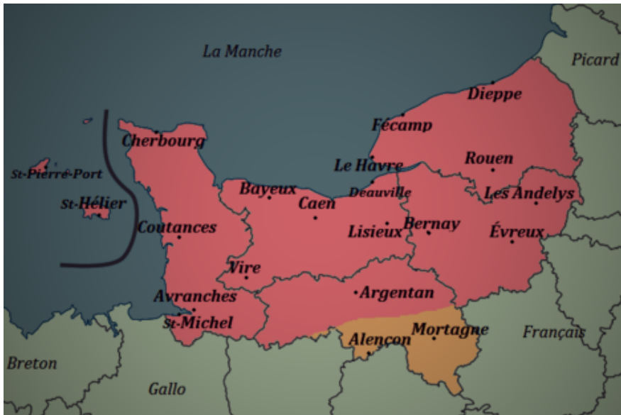
Èl langue neurminde.